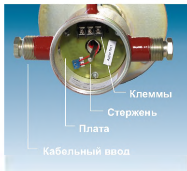
Рис. 2. Устройство корпуса